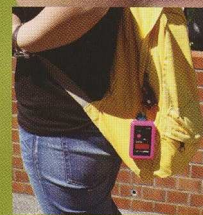
ランドセルやリュックに。