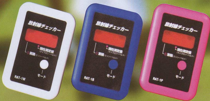
RAT-1W ホワイト JAN 4956497 006901